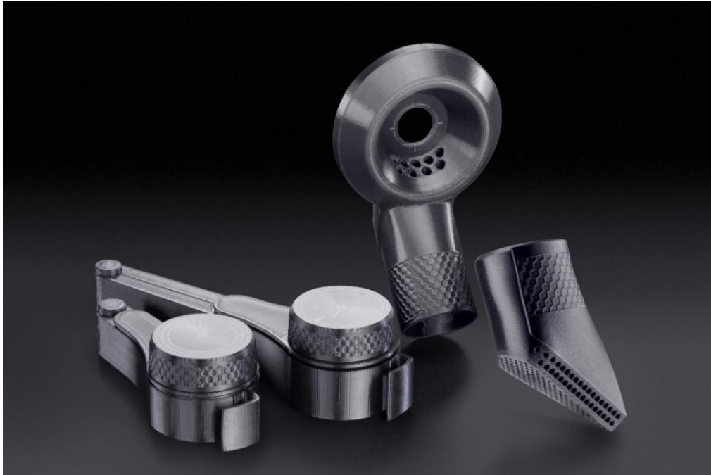
Bild: Vier Miele-Zubehörteile werden bisher über die Plattform von Replique produziert: Ein Kaffee-Clip in zwei Größen, ein Bohrlochabsauger und ein Wertteilabscheider